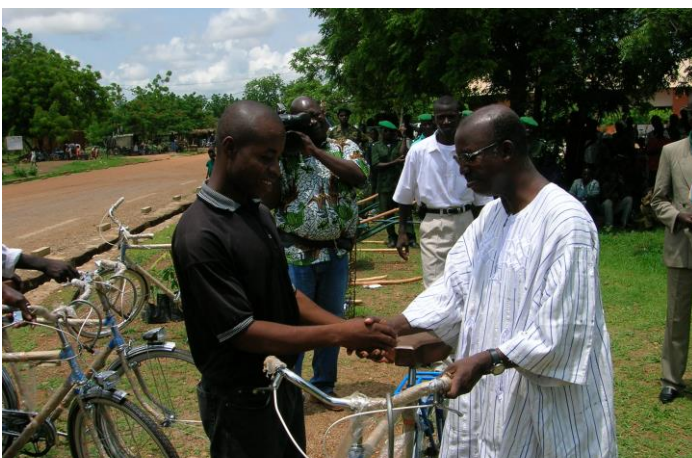
Remise officielle des vélos aux surveillants villageois par le Secrétaire Général du MECV lors du lancement officiel de la campagne de reforestation dans la région du Centre Sud, Juillet 2005

La surveillance du parc à travers la mise en place d'équipes de surveillants villageois (formation et l'équipement en vélos et matériels de terrain) en appui aux brigades forestières d'une part et l'appui en logistique (deux (2) motos YB100 et 8 vélos) à l'Unité de Protection et de Conservation (UPC) de Nobéré. Au total 3162 HJ de sorties de surveillants villageois avec les forestiers ont été réalisées.