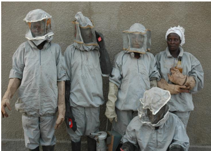
Apicultrices du village de Nadonon (Ziro)

Les mesures d'amélioration des revenus ont été caractérisées par des appuis multiformes à savoir :