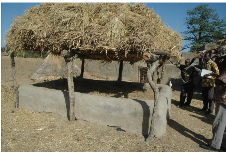
Model de fosse fumière

L'appui à la réalisation de deux cent fosses fumières pour améliorer la productivité agricole des producteurs riverains du parc ;