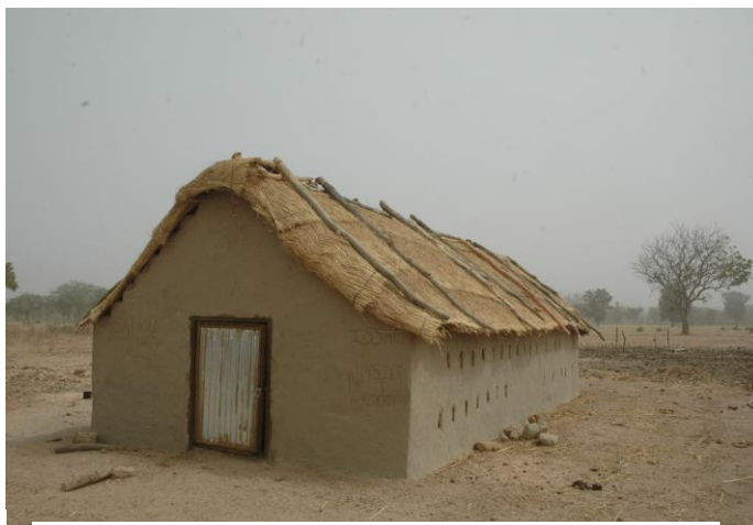
Model de fenil réalisé