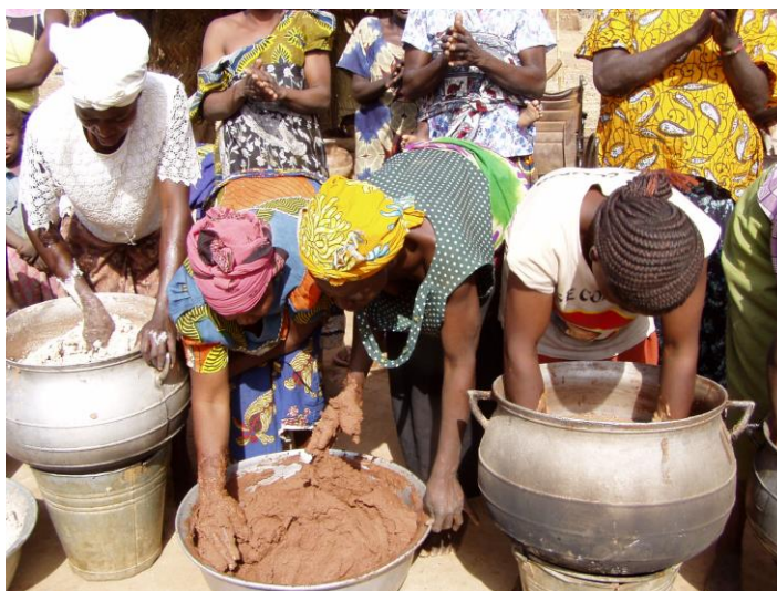
Production du beurre (étape du barattage de la patte)

L'appui aux communautés riveraines à la mise en place de 80 groupes d'intérêts sur les produits forestiers regroupant 838 personnes et l'élaboration de 80 plans d'entreprise des produits forestiers non ligneux sur sept (7) produits forestiers d'un montant d'environ 114 944 925 F CFA. La stratégie d'appui de ces entreprises est en cours de préparation ;