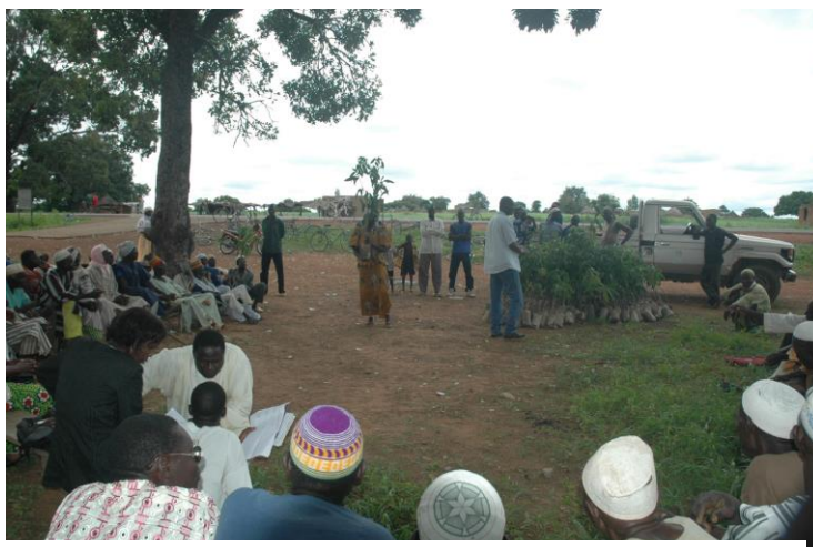
Cérémonie de remise des plants aux ménages dans le village de Téwaka (Zoudwéogo) par NATURAMA dans le cadre des activités de renforcement du couvert végétal

La réalisation d'opérations de reboisements dans les villages riverains. La moyenne des appui en plants aux communautés riveraines a été de l'ordre de 5 000 Plants par an a été maintenue pendant les dix ans de concession.