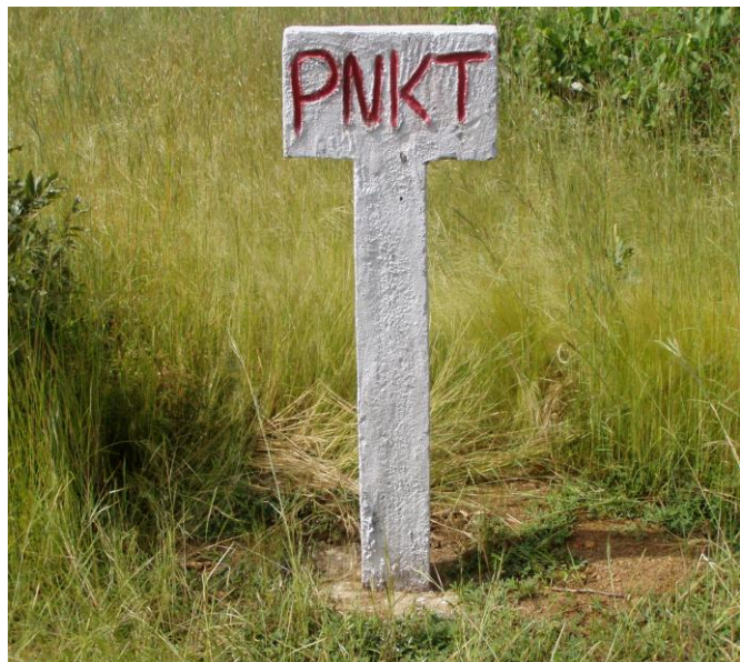
Exemple de borne fixé au niveau de la piste périmétrale du parc

L'amélioration de l'accessibilité par l'ouverture et les entretiens annuels de 242,5 km de pistes;