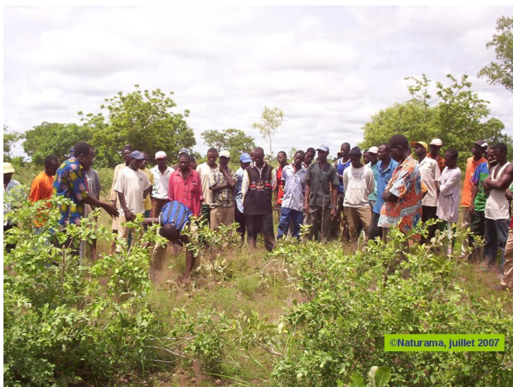
Séance pratique d'application de la Régénération Naturelle Assistée lors d'une session de formation à Guiaro (Nahouri) sur le reboisement et la Régénération Naturelle Assistée