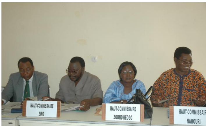
Présidium de la 5 ème session du forum du PNKT avec les quatre hauts commissaires des provinces riveraines du parc