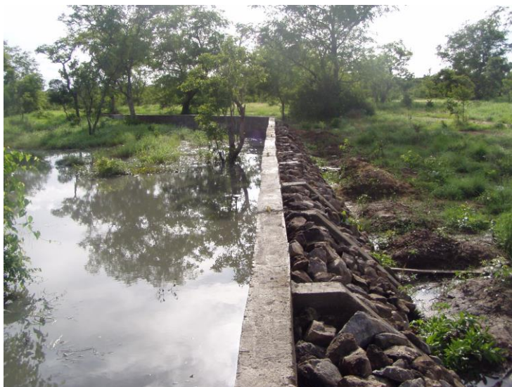
Vue de la retenue d'eau de Kiré

L'amélioration de l'hydraulique faunique par la réalisation de retenue d'eau (Kiré) dans le Parc ;